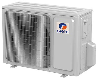
UM 12 - 18